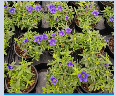
Kontrolle (ohne Hemmstoff)