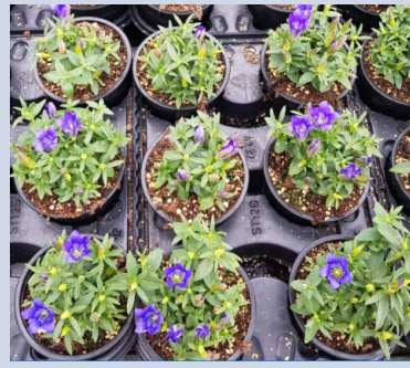
Dazide 0,3% + Carax 0,05%