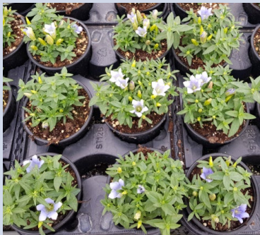
Bonzi 0,3% + Regalis 0,15%

Zu starke hemmende Wirkung, Blütenaufhellung sichtbar, kleine Blüten