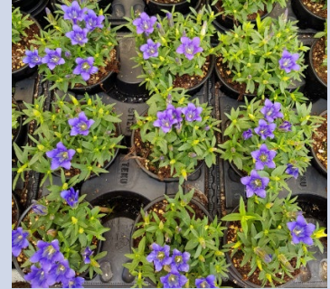
Dazide 0,3% + Bonzi 0,15%